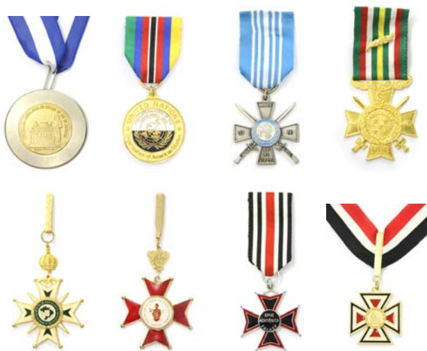
Algumas das medalhas mencionadas no presente histórico.